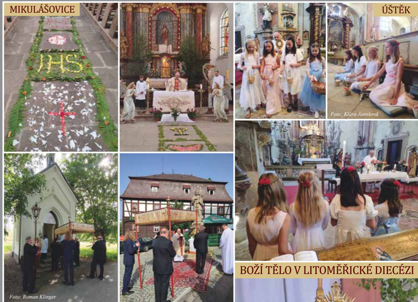
BOŽÍ TĚLO V LITOMĚŘICKÉ DIECÉZI