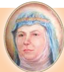
SV. ZDISLAVA Z LEMBERKA